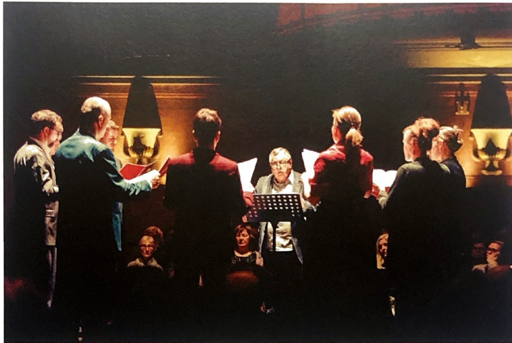
Paul Van Nevel in actie met Huelgas Ensemble. "Bij ons vertrekt alles vanuit de esthetiek van de zangstem."